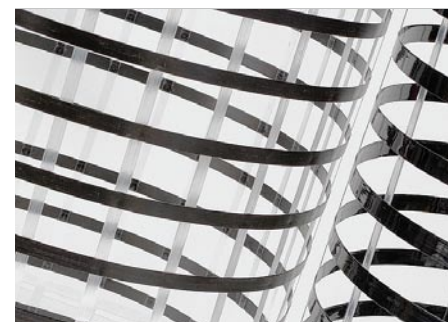
Aramide geogrid, gelamineerd tussen twee lichte thermisch gebonden vliezen (links) en biaxiale geogrids van geëxtrudeerde, aan elkaar gelaste polypropyleenstrips.