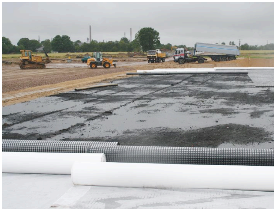
Platform van geogrids voor de kassen in het Duitse Hemmingstedt, links (het gele zanddeel) een toeleveringsstraat.

Waar de sterkte van een ondergrond onvoldoende is om een wiellast of strookbelasting direct te ondersteunen, is een granulaat- of aan-